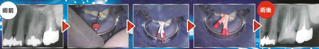
デモ&使用器材 レシプロック・ソフト / 極細アクセス レシプロック / 根管洗浄用チップ EDDY / ユニット直結 往復回転コントラ

申込方法 WEB申込+クレジット決済で5,000円お得! www.mokuda.co.jp もしくは下記に必要事項をご記入の上、右記番号までFAX下さい。 FAX 078-303-2151