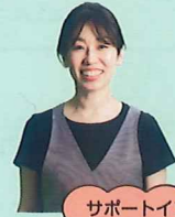
サポートインストラクター