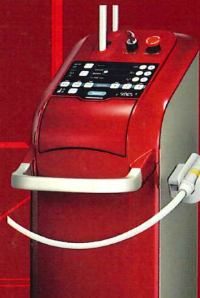
炭酸ガスレーザー ジーシー ガスレーザー Plus 高度管理医療機器 特定保守管理医療機器 23000BZX00030000