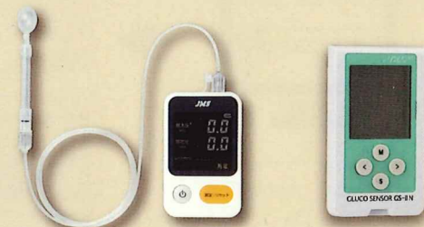
舌圧測定器 JMS舌圧測定器 TPM-02 管理医療機器 22200BZX00758000