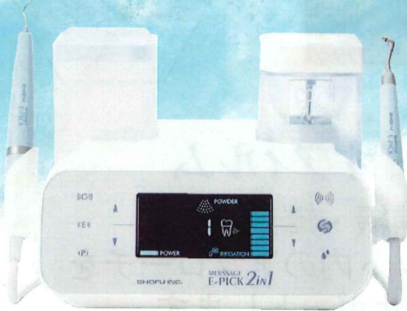
管理医療機器 医療機器認証番号 229ALBZX00017A01 特定保守管理医療機器

各種補綴装置へのメンテナンスにお困りの方… 歯周ポケット内のクリーニングにお悩みの方… ぜひご参加ください♪